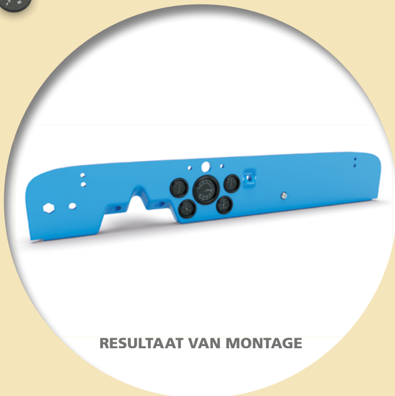
RESULTAAT VAN MONTAGE